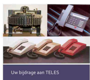
Uw bijdrage aan TELES

Colofon: Eindredactie: Denny van Zanten-van Teylingen. Nieuwsbrief nummer 6 verschijnt in juni/juli 2012. e-mail: dennyvanzanten@ziggo.nl